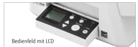
Bedienfeld mit LCD

Der fi-7600 verfügt auf beiden Seiten über ein Bedienfeld. Somit kann der Scanner für rechts- und linkshändigen Einsatz aufgestellt werden. Das im Bedienfeld integrierte LCD zeigt auf einen Blick den Gerätestatus an und ermöglicht die Auslösung von Erfassungsroutinen auf Knopfdruck.