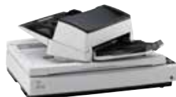
Bis zu 180° schwenkbarer Dokumenteneinzug

Das Designkonzept der beiden Modelle fi-7600 und fi-7700 ist praxisbewährt und ermöglicht die individuelle Anpassung der Scanner an die Vorlieben und Anforderungen der Nutzer. Der automatische Dokumenteneinzug des fi-7700 kann zu beiden Seiten verschoben werden und ist um 180 Grad drehbar.